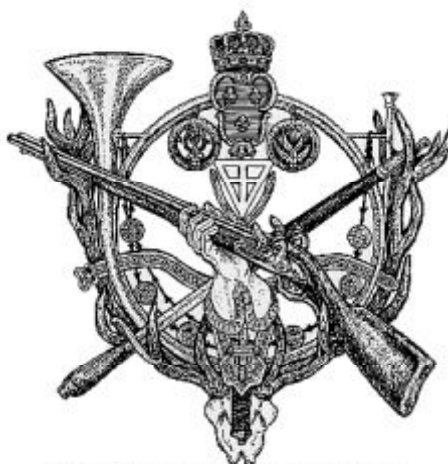
LES PORTE-ARQUIERISE DU ROY

Du nouveau sur les loups : Un ami m'a envoyé un « recueil d'attaques de loups sur des humains » de plus de 60 pages, qu'il avait récupéré sur internet et qui m'a fortement intéressé. Bien que les traducteurs de cette notice en anglais soient des « lycophiles », ils écrivent certaines choses pouvant éclairer l'hypothèse du loup dans l'histoire de la