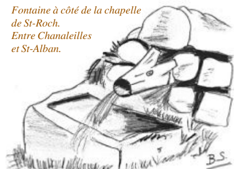
Fontaine à côté de la chapelle de St-Roch. Entre Chanaleilles et St-Alban.