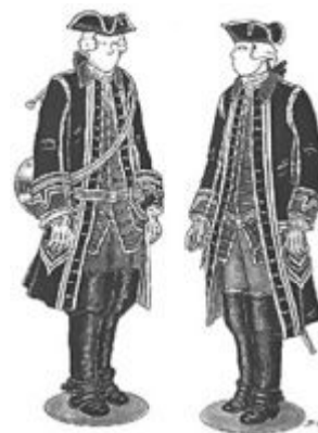
Tenues de l'équipage de la Louveterie Royale Sous Louis XV vers 1765 Sous Louis XVI vers 1781