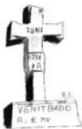
Croix à St-Martin-de-Born (48)

Je partage leur opinion quand ils écrivent : « Il ne semble pas y avoir de doute qu'en de RARES occasions et dans des CIRCONSTANCES PARTICULIERES, des loups ont pu attaquer et tuer des gens. ...Les attaques, en général, ne sont pas habituelles mais épisodiques et l'humain ne fait pas partie des proies naturelles du loup ». Qu'en est-il pour la bête ? Ils y consacrent près d'une page et ils écrivent : « Cet événement reste l'un des épisodes historiques les mieux documentés sur la prédation des loups sur les hommes... Si quelques uns des cas sont dus à différents agents autres que des loups, les historiens qui ont examiné cette histoire pensent qu'il y a une très forte probabilité qu'un loup ou des loups aient été impliqués dans de nombreuses morts ».