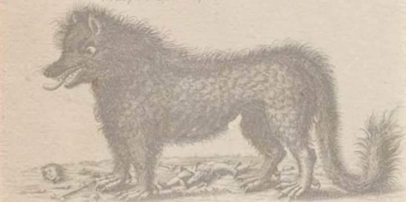
Figure du Monstre, qui devale le Gévaudan La Bête est de la taille d'un jeune Chamois elle attaque de préférence les Femmes et les Enfants elle leur lève leur capote la tête et l'emporte Elle est promise 2500 l à qui tuera cet animal.

C'est dans ce contexte que se déroule le spectacle son et lumière de « La Bête du Gévaudan ». Une histoire qui dépasse le simple fait divers et qui mobilisa de nombreuses troupes royales à une époque où la presse relata assidûment l'affaire dans tout le pays.